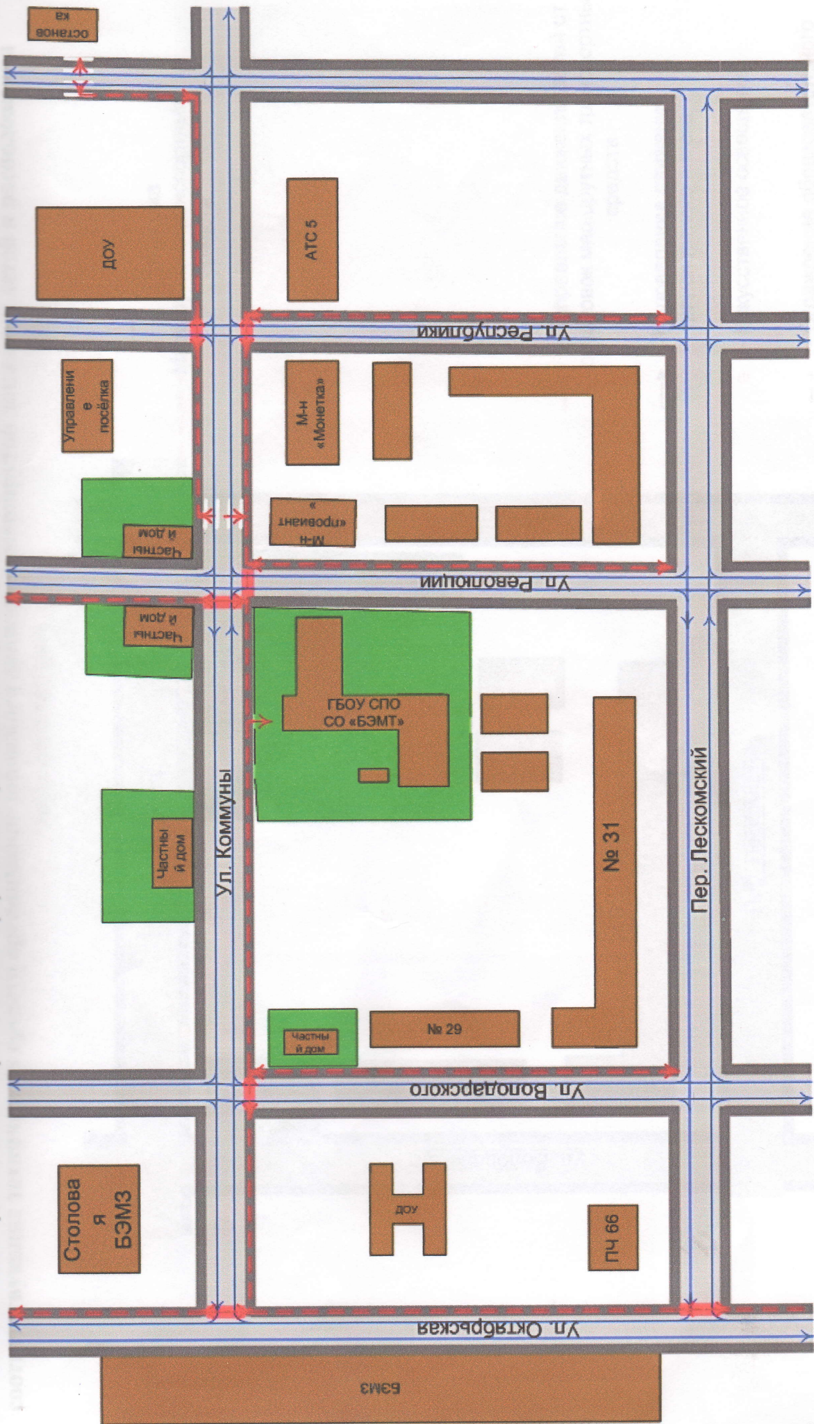
1. Район расположения образовательного учреждения, пути движения транспортных средств и детей (обучающихся, воспитанников)