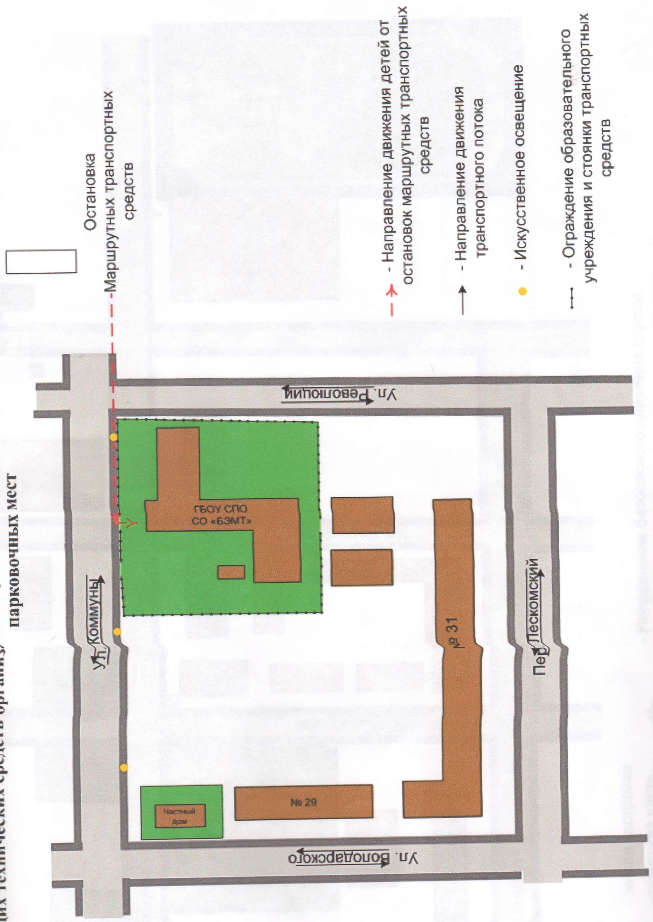
2. Схема организации дорожного движения в непосредственной близости от образовательного учреждения с размещением соответствующих технических средств организации дорожного движения, маршрутов движения детей и расположения парковочных мест